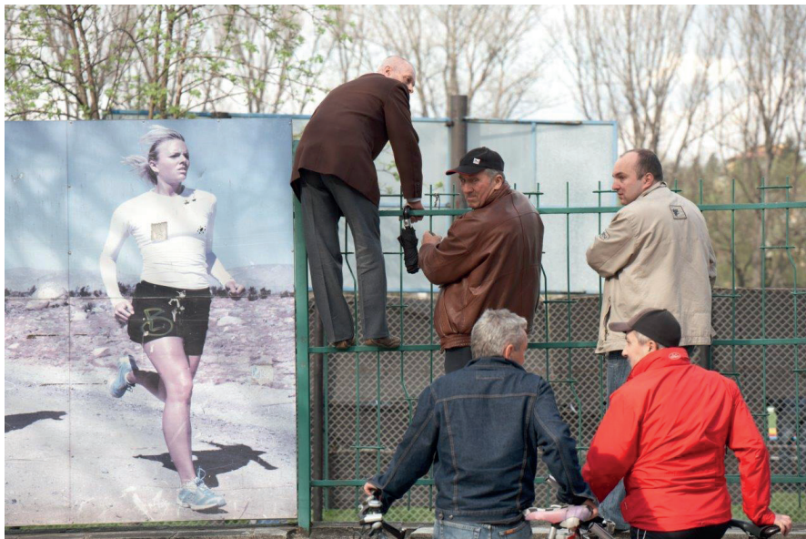
Tymoteusz Lekler fotografia

Kolejna wystawa w Galerii Wydziału Inżynierii Procesowej i Ochrony Środowiska na Politechnice Łódzkiej to odzwierciedlenie emocji jakie wywiera sport na sztukę a w szczególności na sztuki wizualne.