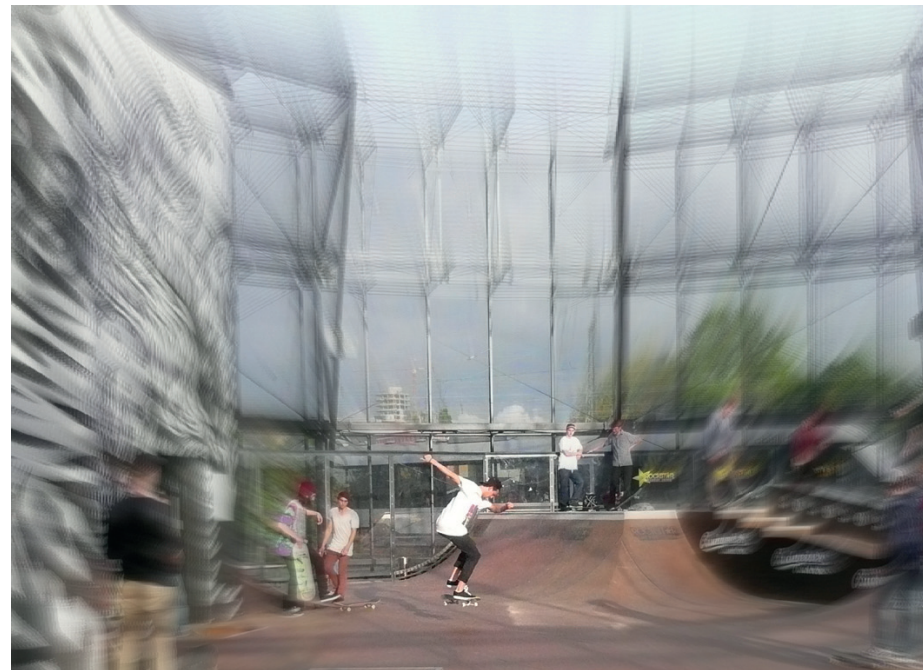
Tadeusz Halatek fotografia